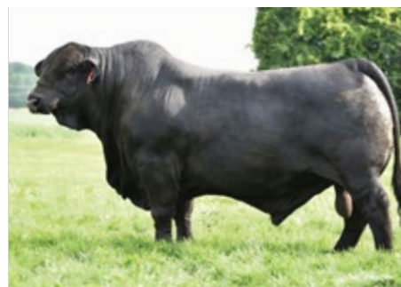
DMR TEXAS STAR 222A47