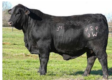
MC ELEGIDO 924W6

Top 10% para peso al destete y combinado materno, Top 5% para peso final y Top 2% para circunferencia escrotal.