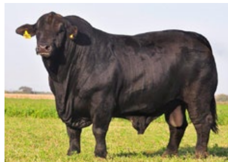
POZO 4486 RELEVANTE

Un sobresaliente hijo de RELEVANTE en madre COMODORO, quien resulto Tercer Mejor Hembra Nacional Brangus 2010, siendo una donante muy consolidada en el programa de transferencias embrionarias de Cabaña La Sultana. Combinación genética destacada y muy probada, con líneas tradicionales que aportan resultados y consistencia.