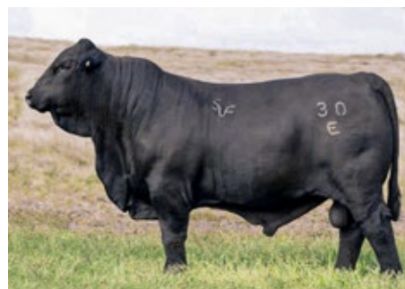
T3 BROADWAY 30E (hijo)