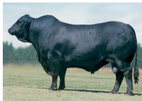
LAS LILAS 5327A PATRICIO G5