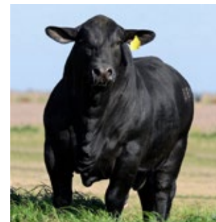
REYES 381E NUFF SAID LANIN T/E

Top 1% para peso al destete y peso final, Top 20% para circunferencia escrotal, Top 25% para área de ojo de bife y Top 10% para grasa dorsal.