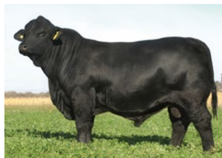
MORRIS AONIKENK 272 GLADIADOR T/E