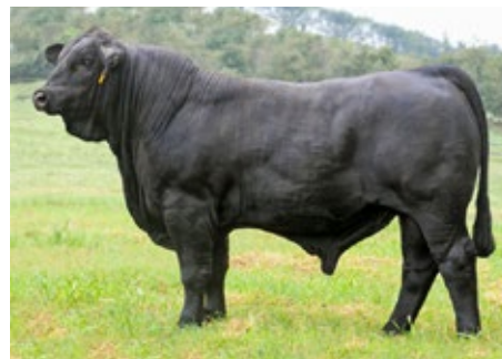
NEW VISION OF SALACOA 209Y2

Top 25% para peso al destete, Top 15% para peso al año de vida, Top 4% para área de ojo de bife y Top 1% para preñez en vaquillas e índice terminal.