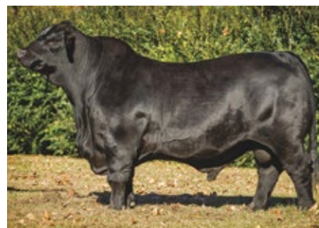
RANCHO 1256 FRANCESCO T/E