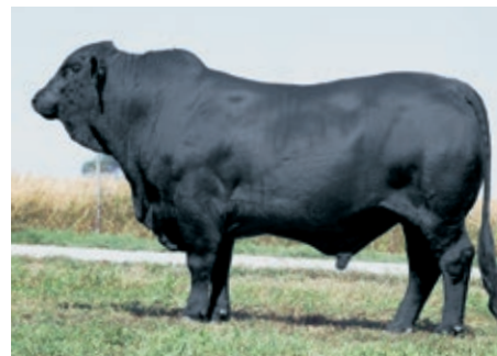
LAS LILAS 5431 A PATROL LASPIUR

Top 20% para peso al destete y para peso final, Top 15% para área de ojo de bife y Top 30% para grasa intramuscular (marbling).