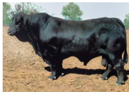
LAS LILAS 5909F RELMUN 6774B