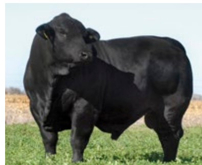
MORRIS AONIKENK 272 GLADIADOR T/E

Top 30% para peso al nacer y para grasa intramuscular, Top 20% para peso final y Top 15% para grasa dorsal.