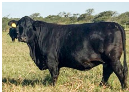
REYES 130X LEAD GUN PATRICIO T/E