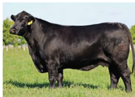
CAA CUPE 1226 GLADIADOR

Top 2% para peso al destete y para peso final, Top 5% para combinado materno y Top 30% para circunferencia escrotal.