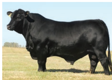
CORRALERO 8435 CRURUPAY F10C