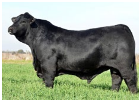
SULTANA LONQUIMAY 882 YAS T/E

Top 5% para peso al destete y peso final, Top 15% para área de ojo de bife y Top 5% para grasa intramuscular.